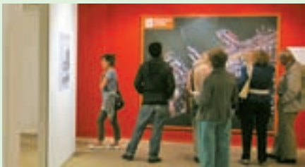
A CURA DI MATTEO FORCINITTI